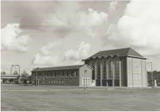
De kerk van de Doopsgezinde Gemeente aan de Noordmo- lenwerf bij de Galerij, sept. 1954