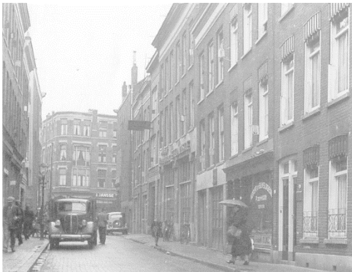
De Nadorststraat in 1939