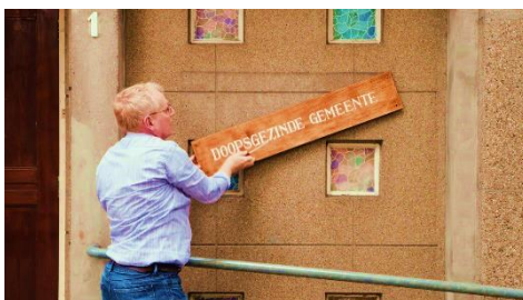
Het afnemen van ons naambord