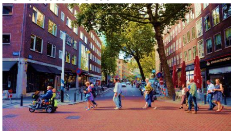
De processie naar De Heuvel