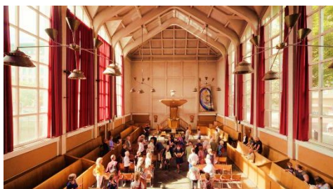
De laatste dienst