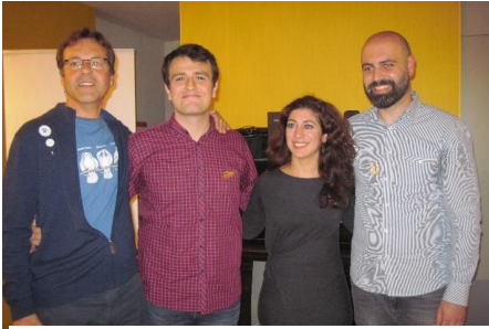
documentaire Bloedbroeders vertonen i.s.m.the Hague Peace Project