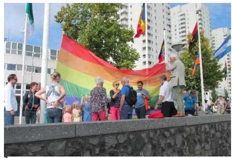
de Vredesvlag hijsen op de Maasboulevard