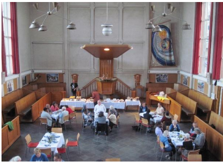
een maaltijd met vluchtelingen in ons kerk-restaurant, inclusief pianomuziek