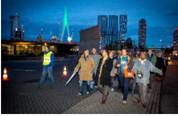
vredeswandeling langs de brandgrens, afsluitende sprekers op het Schouwburgplein