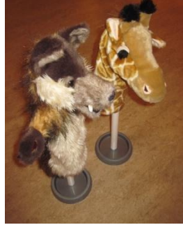
cursus-avonden geweldloos communiceren: met kleine stappen leren van de Jakhals en de Giraf