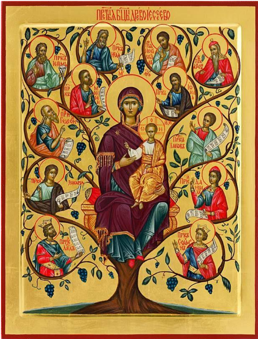
De vijf moeders van Jezus